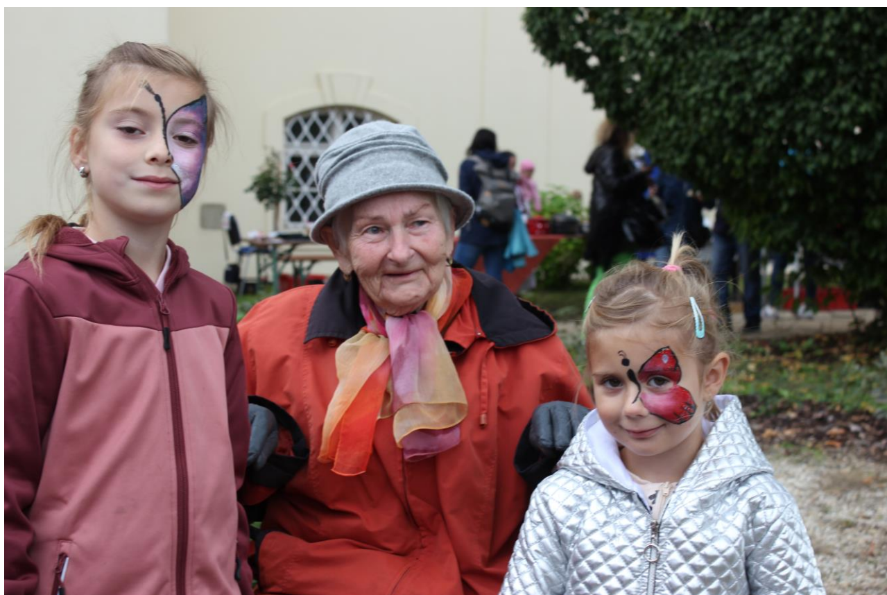
Foto: seniorka s dětmi

prohlídka vojenského ležení s polní kuchyní a projížďka na ponících. Odměnou pro soutěžící děti byl balíček sladkostí.