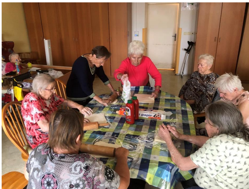
Foto: seniorky při aktivizačním pečení

Ne příliš pěkné počasí nám mnohdy neumožňovalo s klientkami trávit více času v zámeckém parku, a tak jsme se zaměřili na jiné aktivity, mezi které patřily trénink paměti, stolní hry, povídání si a čtení tolik oblíbených pohádek a příběhů.