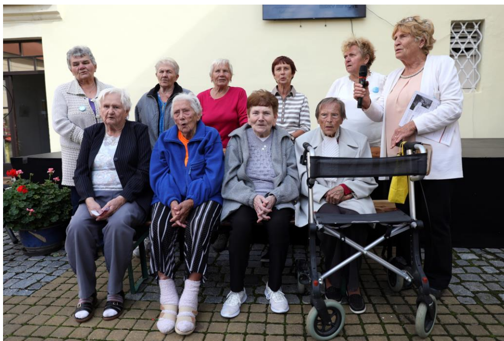
Foto: pěvecké vystoupení senierek

Večerní program zakončil na setmělém nádvoří zámku působivý koncert Moravského kvarteta a po něm společné posezení se slovenskými přáteli při harmonice, písničkách a vzpomínání na společnou historii se sklenkou moravského vína v ruce.