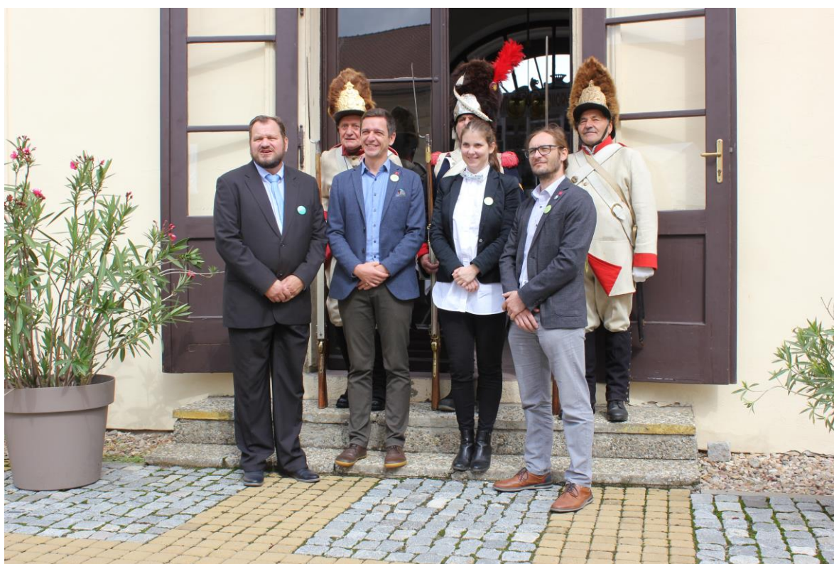
Foto: hejtman JmK a pozvaní hosté