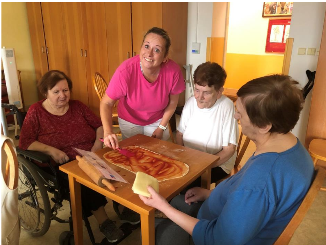
Foto: seniorky při výrobě slaného závinu

Ke konci měsíce jsme pečení neměly stále dost, a tak jsme uspořádaly poslední zářijovou společnou akci a tou bylo pečení jablečných štrúdlů. Ty klientky, které se i v takovém počasí chtěly projít parkem, tak se zúčastnily sbírání jablek. Musím přiznat, že to bylo pro ně v tuhle dobu poněkud netradiční ráno, ale bylo to spontánní, příjemné, a hlavně je to bavilo. Připomnělo jim to práci, kterou také dříve vykonávaly ve svých domovech. Po přineseném košíku jablek jsme se pak všechny společně vrhly do samotného pečení štrúdlů. A protože jsou naše klientky velice šikovné a práce nám šla pěkně od ruky, netrvalo dlouho a zámek se brzy vanula vůně jablek a skořice.