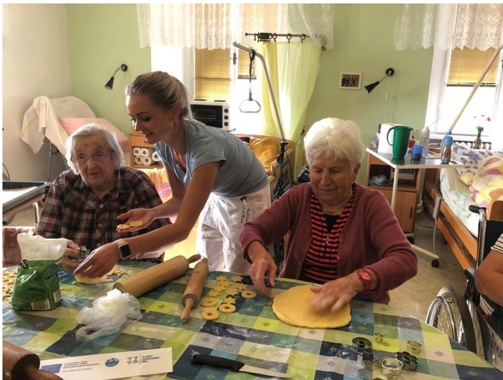
Foto: seniorky při výrobě lineckého cukroví

Ovšem hlavní náplní měsíce byly horentní přípravy na zámecké slavnosti, které se konaly v polovině měsíce. Velké přípravy jsme si s klientkami více než užily. Spolu s kolegyněmi jsme vytvořily na jednom z našich pokojů příjemnou „dílničku“, kde se scházely klientky i z jiných oddělení. Na našem prvním takovém setkání jsme všechny dohromady vyráběly drobné keramické předměty, které pak byly k zakoupení i zámeckých slavnostech.