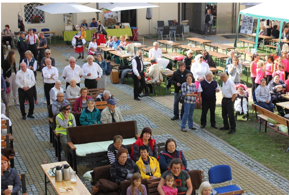
Foto: slavnostní nádvoří