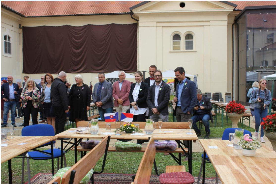
Foto: pozvaní hosté na nádvoří

Portál zámku byl slavnostně vyzdoben, na schodišti a v průjezdu byly instalovány uniformy vojáků z období Bitvy u Slavkova, společenskou místnost zdobila výstava fotografií a prací klientů. Na nádvoří bylo připraveno posezení a občerstvení pro návštěvníky, prodejní stánky s nejrůznějším zbožím včetně výrobků klientů. Na podiu současně probíhal kulturní program, v němž se vystřídali folklorní krojované soubory z okolních obcí, které jsou častými hosty v našem domově. S hudebním pásmem vystoupily také naše seniorky, děti z místní základní školy a ZŠ Otnice, děti z Rodinného centra Lípa a další účinkující. Pro naše partnery ze Slovenska jsme zorganizovali výlet na Mohylu míru a nechali jsme je tak nahlédnout do historie našeho regionu prostřednictvím instalované expozice připomínající slavnou bitvu.