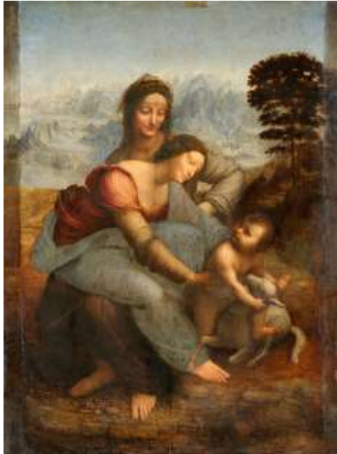
(Obraz Leonarda da Vinciho, Panna Marie, boží dítě a sv. Anna)

Svátek svaté Anny se slaví 26. července a váže se k němu pranostika: